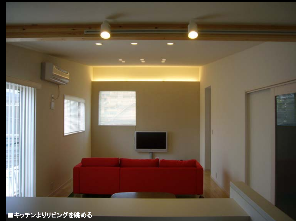
■キッチンよりリビングを眺める